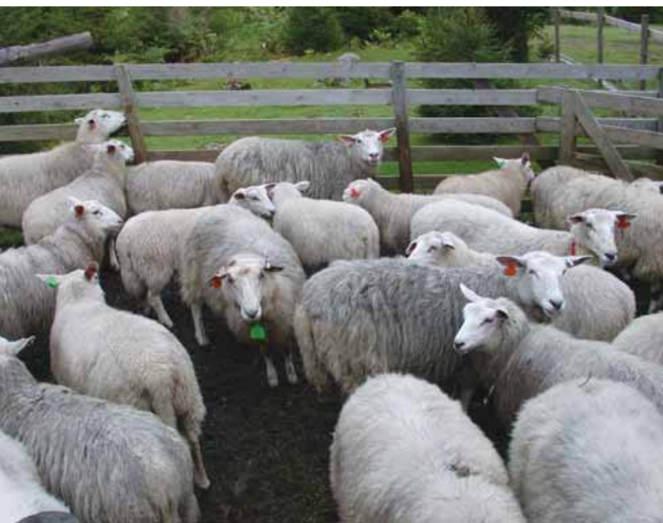
Straks sauene er sanket om høsten bør en sortere lamma etter som de er slaktemodne eller ikke.

I gjennomsnitt var slaktevekta på lamma til medlemmene i Sauekontrollen i 2007 19 kg og de oppnådde slakteklasse R. I teorien vil slike lam bli betalt med kr 53,- pr. kg nå i høst, som totalt vil gi oss ca. kr 1.010,- pr. lam. Det kan selvfølgelig være fristende også med slike lam å forsøke å få med seg de siste 250 kronene, men da vil