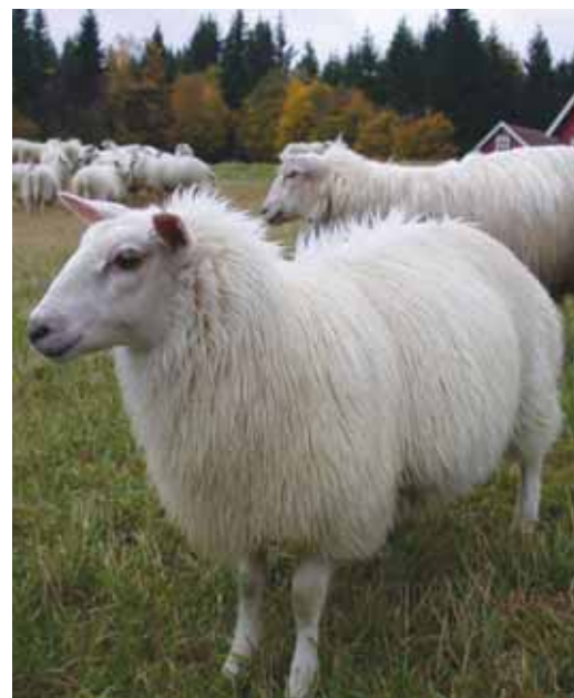
De lamma som er slaktemodne bør leveres til slakting så fort som mulig. Ikke slaktemodne lam settes på godt beite eller god innefôring.