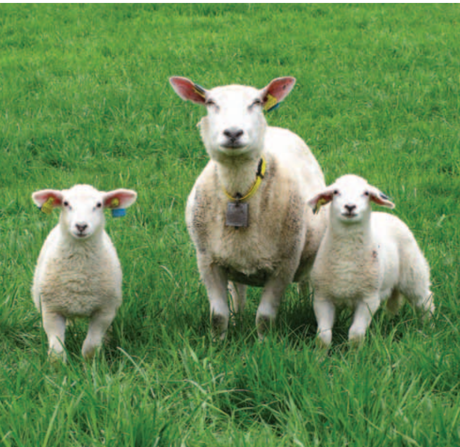
Friske sauer på friske føtter er fortsatt standarden for norsk sauehold.

Det blir nå enda viktigere enn noen gang å fange opp flokker med mer alvorlige fotrâtesymptomer slik at smitte ikke spres videre fra disse, men at den kan bekjempes. Alvorlig fotrâte skal ikke få spre seg videre i norsk sauehold.