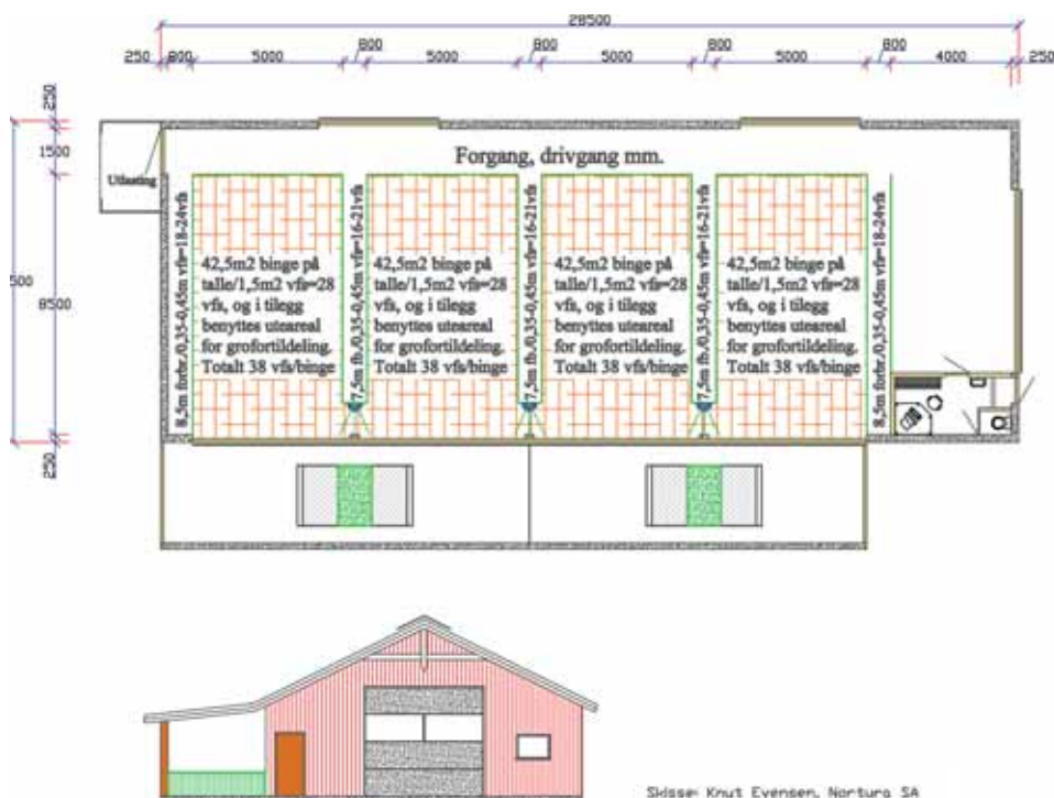
Skisse: Knut Evensen, Nortura SA

Løsninger med luftegård med tak vil bli noe mer arbeidskrevende med tanke på at utearealet må skrapes eller strøs.