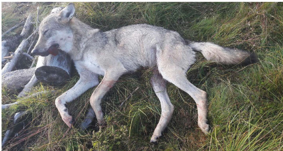
Slik så den ut ulvetispa som maktet å ta livet av 303 sau/lam i fjor sommer.

De rammede sauebøndene får ifølge fylkesmannen i de to fylkene utbetalt 16,8 mill. kroner i erstatning. I tillegg kommer de samlede kostnadene for selve skadefelling (det tok jo mer enn to måneders intens jakt å få has på ulvetispa). Inkludert innleie av jaktlag m/hunder, plotthund samt administrasjonskostnader i Direktoratet for