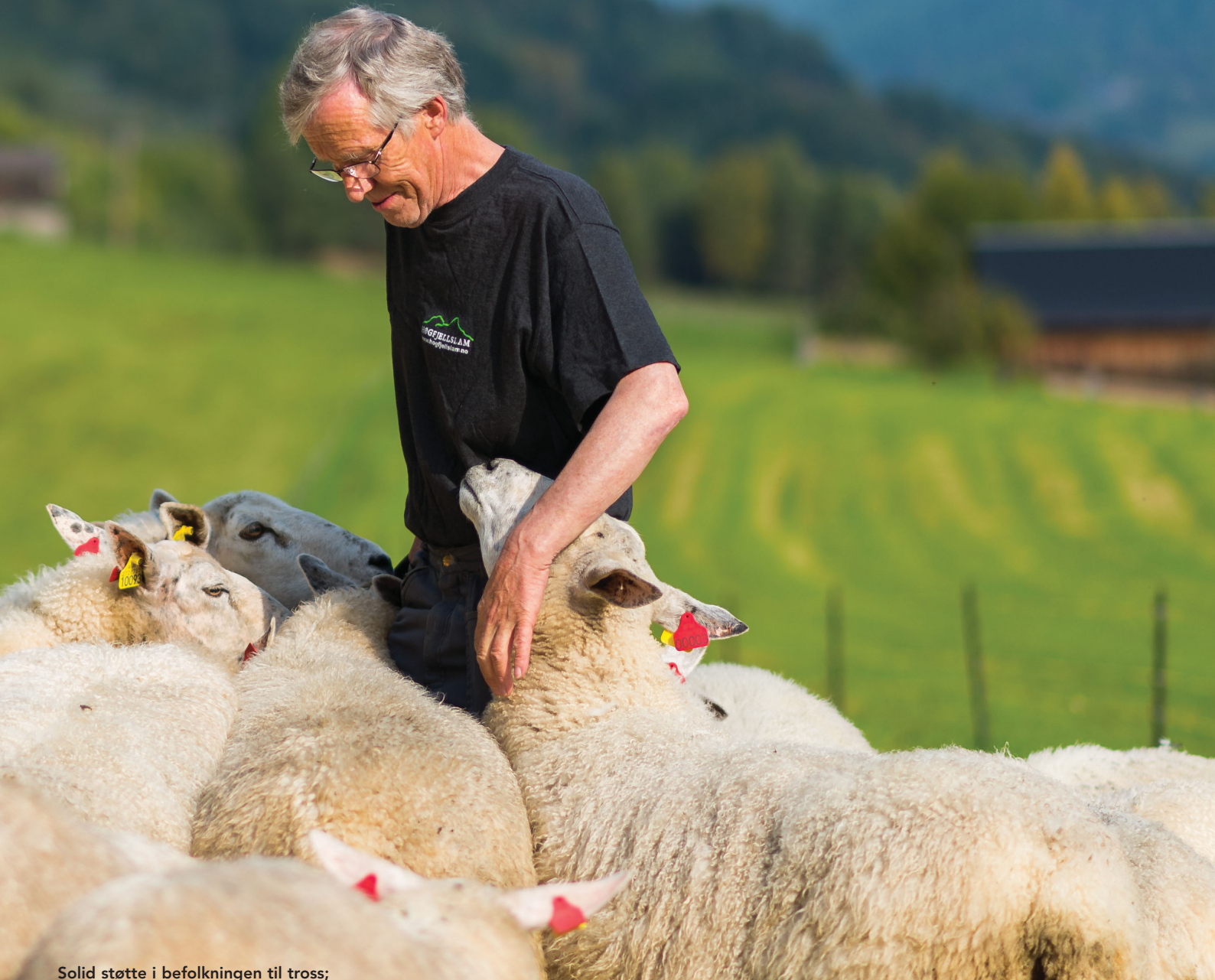
Solid støtte i befolkningen til tross; sauebøndene frykter en ny blodig rovvltsommer.

at 52 % blant personer i ulvetomme områder mener det er « passe som det er » med ulv. Dermed blir 70 % av befolkningen i ulvefrie områder negative til å ha ulv i naturen der de bor.