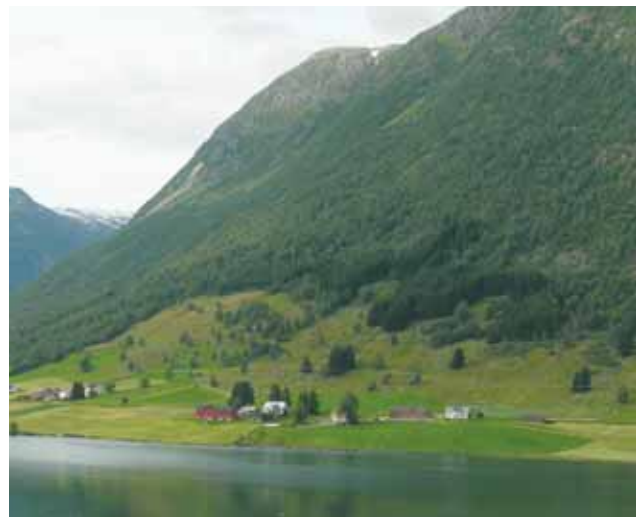
Innmarksbeita ligg ofte i librotet ovafor fulldyrka mark som her frå Sogndal.

Der det er godt sigevatn kan hausting av god avling skje år etter år utan tilføring av næring. 50-100 føreiningar per dekar kan ein heilt sikkert rekne, og mykje meir på dei beste areala. Dette kan spare beiting på store areal av den dyrka jorda, som dermed kan brukast til produksjon av vinterfôr eller åkervekstar.