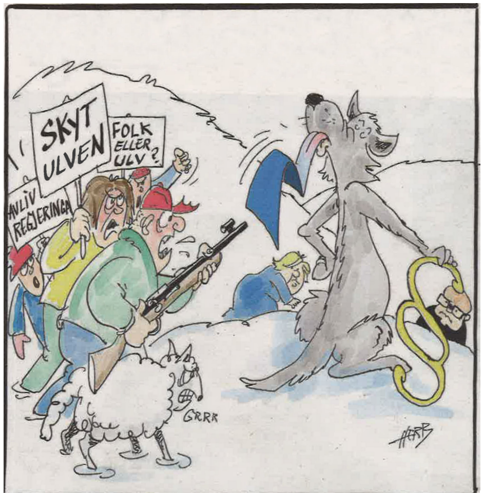
Slik beskriver Oppland Arbeiderblads HERB den politisk betente ulvestriden.