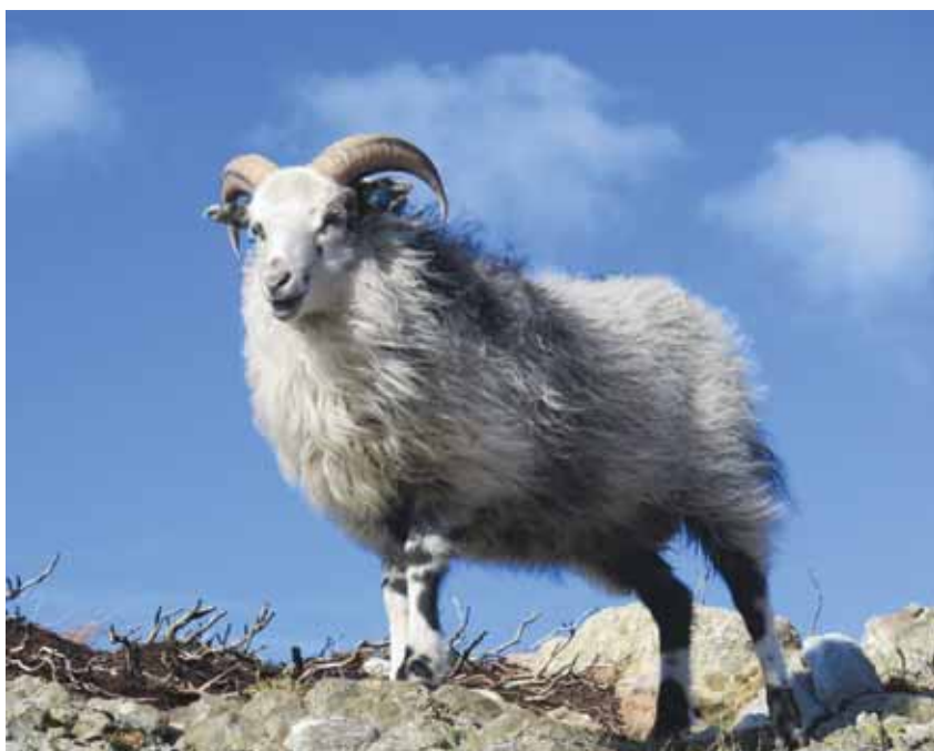
Hilde poengterer at det er viktig å kun bruke værter som har evnen til å røyte ulla i avl, siden egenskapen er arvelig.