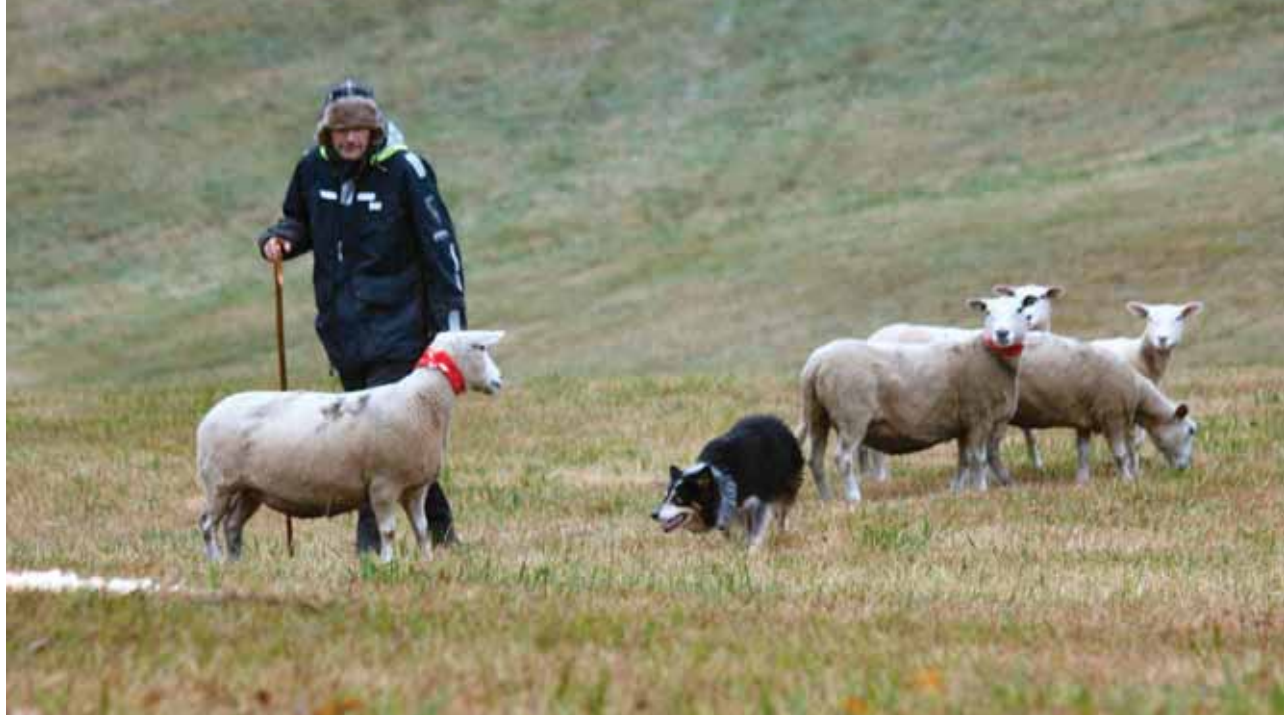
Singling av sau er for de mer drevne hundene.