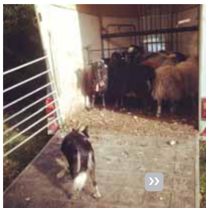
Nærarbeid krever også hunder med erfaring.

Klasse 3: På dette nivået må hunden være en stødig arbeidshund og takle de fleste arbeidsoppgaver den kan komme borti på en gård. Den skal også kunne skille fra dyr og hente på større avstander. Klasse 3-hunder kan ofte hente sau på avstander fra 800 meter til opp mot 1 km i fjellet. Hunden må også kunne vise større grad av selvstendighet i arbeidet og kunne takle situasjoner der den må gjøre egne vurderinger. Klasse 3-hundene er mer erfarne hunder, og