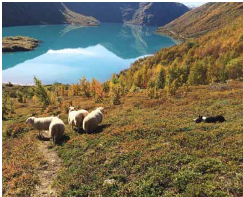
En veldressert gjeterhund gjør jobb for 10 personer.

som er på klasse 1-nivå selges i dag for mellom 18-25.000 kroner. Prisen på en hund som tilsvarer klasse 3 ligger på 35.000 kroner og oppover. De beste hundene i utlandet selges ofte på auksjon for 60-120.000 kroner. Disse er ofte godt voksne hunder, der en kan