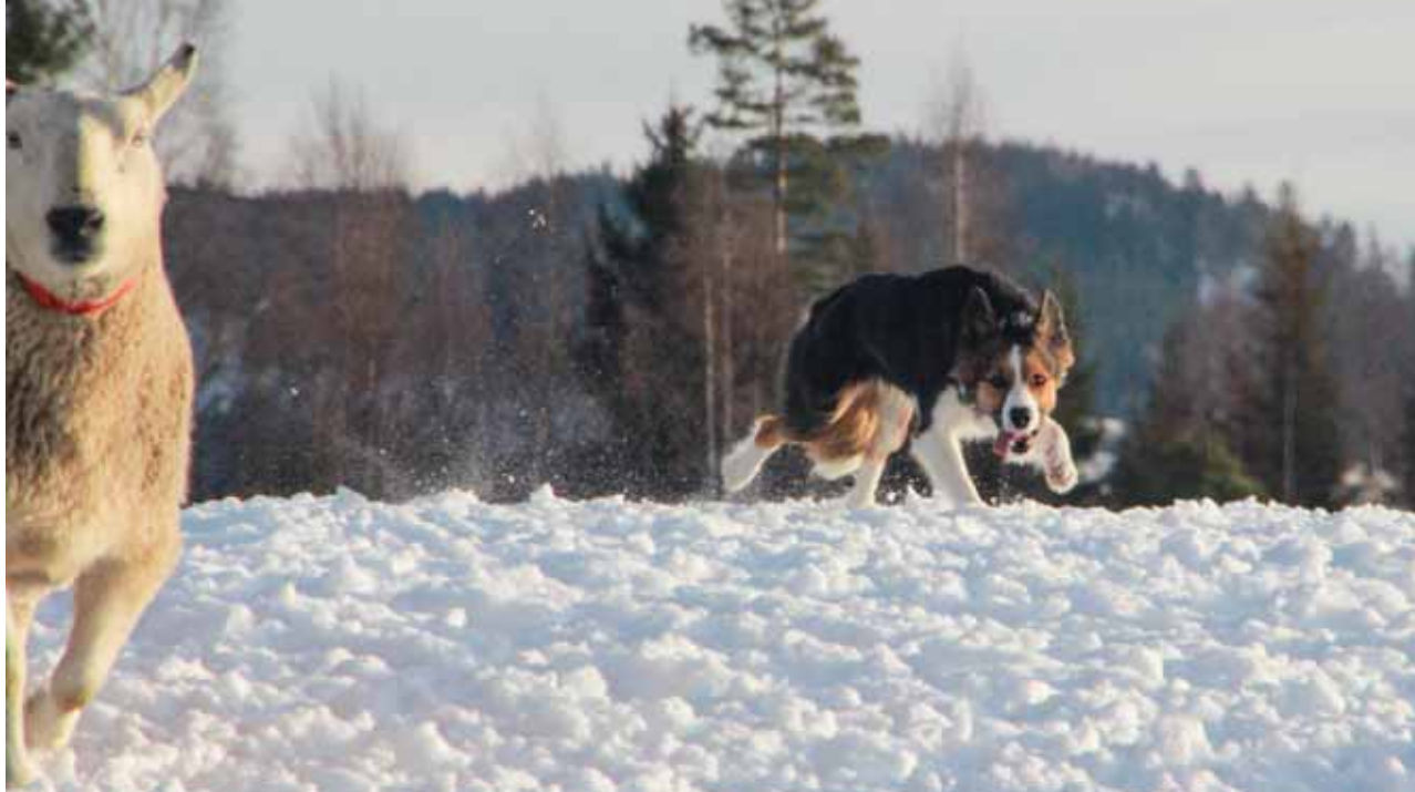
Når unghunden viser evner til å skjerme kan vi starte treningen med sau.

er det vi kaller tent på sau. Det kreves at slike hunder må lære ulike kommandoer for å kunne brukes i praktisk arbeid. Hunder på dette nivået er fra ca. 6 mnd. til 1 år, men dette kan variere.