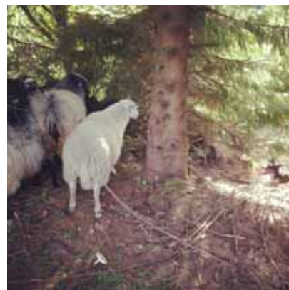
Under tilsyn og sanking på utmarksbeite kan hundene ofte komme opp i situasjoner der de trenger erfaring.

Alder på hunden på de ulike nivåene kan variere fra det som er nevnt her. Vi har allikevel satt det som en pekepinn. De mest erfarne førerne kan ha enkeltindivid som mestrer klasse 3