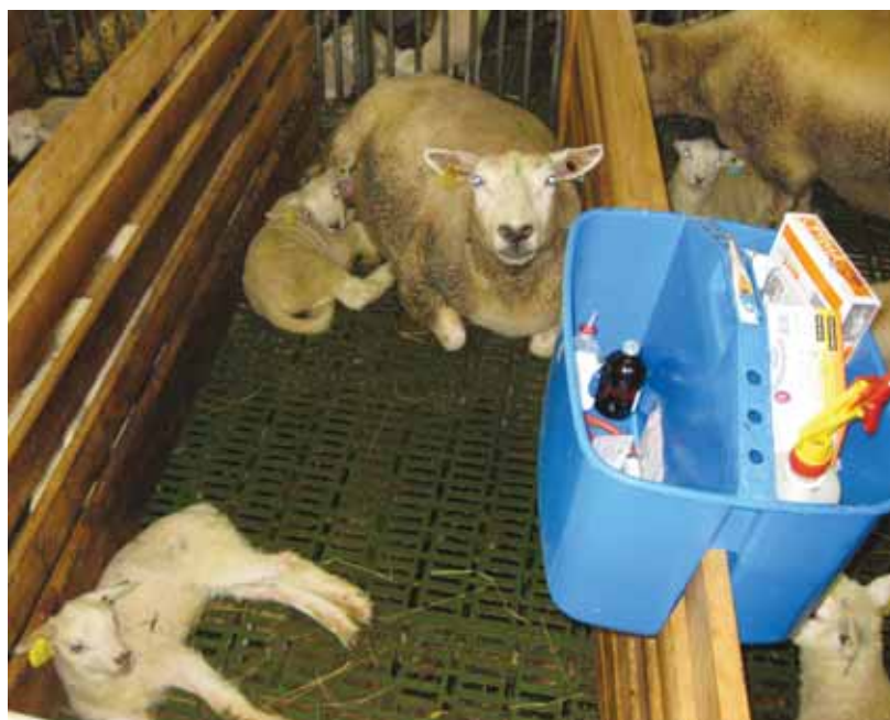
En jurbønne som veterinæren kan bruke til å ha med utstyr og medisin inn i fjøset anbefales.

finnes en vask med varmt vann, for vask av hender og medisinflasker etc. For å unngå unødvendig søl i selve slusen bør det også være spylemuligheter for støvler og annet utstyr i husdyrrømmet.