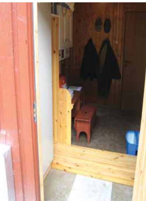
Eksempel på permanent sluse.

Er det muligheter for det så anbefaler vi å ha god avstand mellom fjøsinnngangene. Besøksinngangen bør være mest mulig skjermet fra gårdstrafikken. Det er svært uheldig dersom veterinær, på sin ferd mellom bil og inngang, må gå gjennom spor tråkket med møkkete støvler eller på annen måte forurenset underlag. På denne måten blir den urene sonen av slusen blandet med gårdens eventuelle smitte, og sjansen er stor for at smittestoffene følger med den besøkende til neste gård.