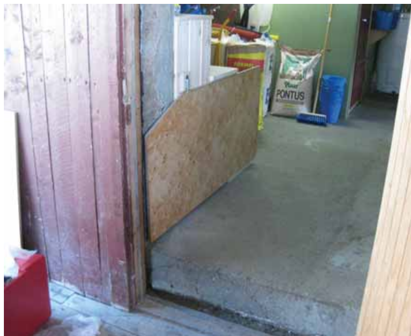
Eksempel på sluse der en plate kan slås ned ved behov.