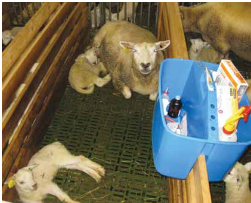
En jurbøtte som veterinæren kan bruke til å ha med utstyr og medisin inn i fjøset anbefales.

finnes en vask med varmt vann, for vask av hender og medisinflasker etc. For å unngå unødvendig søl i selve slusen bør det også være spylemuligheter for støvler og annet utstyr i husdyrrømmet.