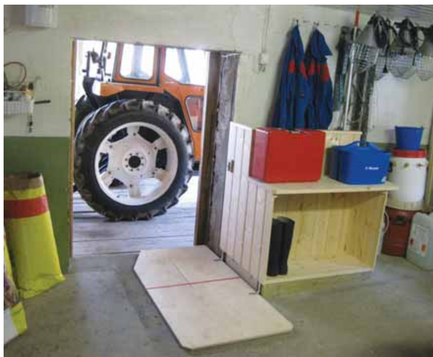
Den røde streken definerer skillet og benken inneholder hylle til koffert, støvler og dresser bak.

Tekst og foto: Veterinær Marie Skavnes, Tretten.