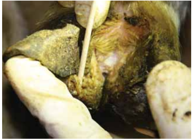
Forandringer typisk for fotrâte, med håravfall, rødme, belegg og delvis oppløsning av hornet i klauvspalten. Begge tilfeller forårsaket av lavvirulente («snille») fotrâtebakterier. Det er kun laboratorietester som kan avgjøre hvilken variant som er årsaken.

kanskje særlig i flokker med pelssau eller spæl.