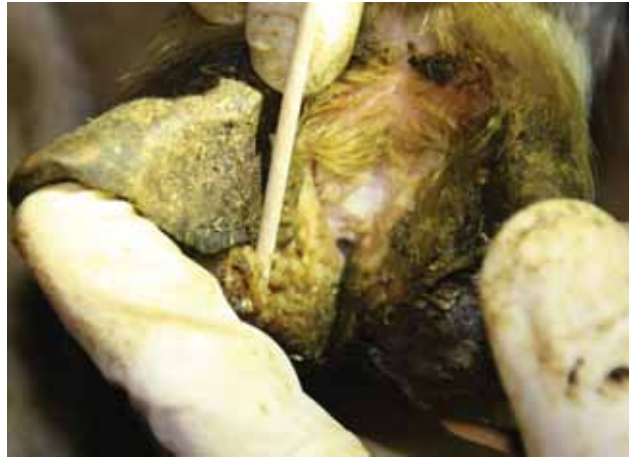
Forandringer typisk for fotrâte, med håravfall, rødme, belegg og delvis oppløsning av hornet i klauvspalten. Begge tilfeller forårsaket av lavvirulente («snille») fotrâtebakterier. Det er kun laboratorietester som kan avgjøre hvilken variant som er årsaken.

kanskje særlig i flokker med pelssau eller spæl.